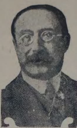
EL LIDER SOCIALISTA FRANCÉS que ha triunfado en Narbona